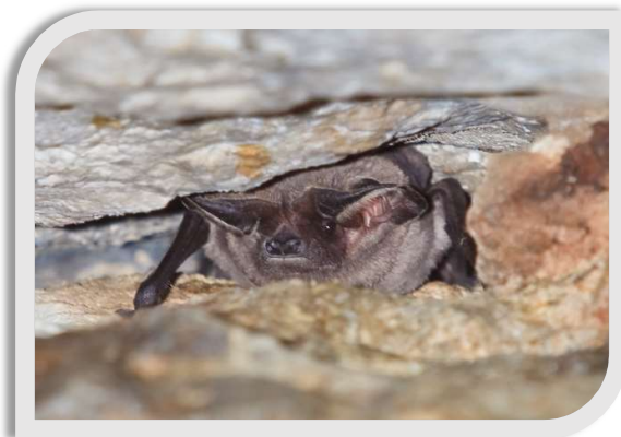
Figure 2 : Molosse de Cestoni et Vespère de Savi

Plusieurs espèces sont susceptibles de fréquenter les falaises, mais deux sont tout particulièrement inféodées au milieu rupicole, il s'agit du Molosse de Cestoni et du Vespère de Savi.