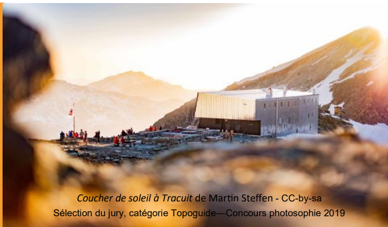
Coucher de soleil à Tracuit de Martin Steffen - CC-by-sa Sélection du jury, catégorie Topoguide—Concours photosophie 2019