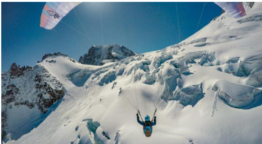
Voler au paradis de Guillaume Segers - CC-by-sa

Le topoguide a également été enrichi de nombreux points de passage décollage et atterrissage, ceci ouvrant de nouvelles perspectives pour le développement de cette activité sur camptocamp !