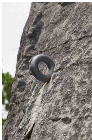
Amarrage de type « broche scellée »

Connecteur : mécanisme ouvrable qui permet de se relier directement ou indirectement à un amarrage (par exemple mousqueton, maillon rapide).