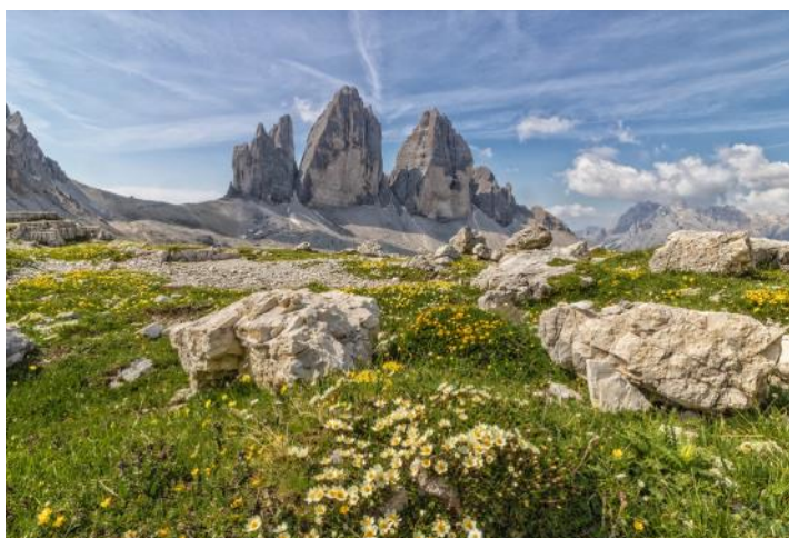
Lavaredo par sambuco - CC-by-sa Prix de la catégorie Topoguide du concours 2019