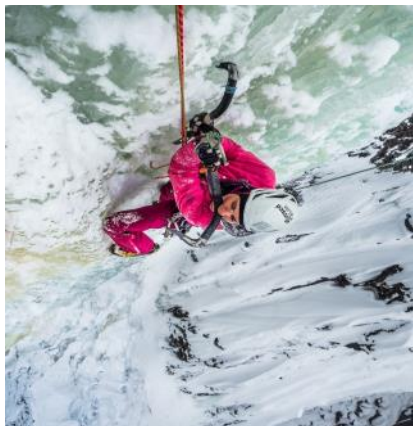
Flo dans Juvsoyla à Rjukan - Norvège