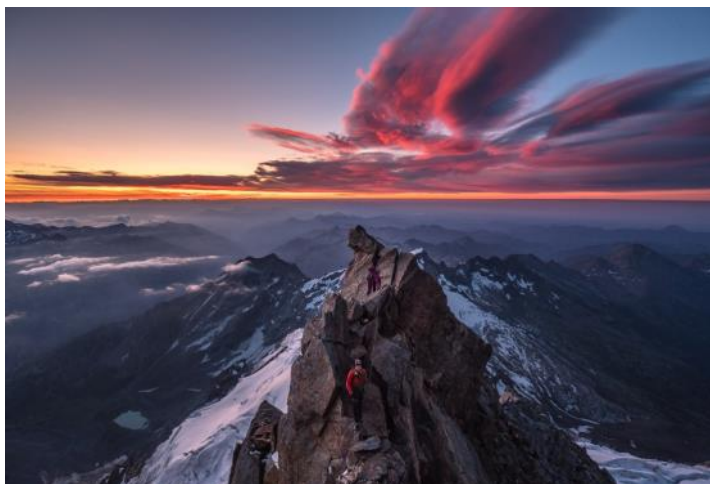
Aux aurores sur la Cresta Signal de Nicola Beltraminelli - CC-by-sa Prix de la catégorie paysage du concours 2019