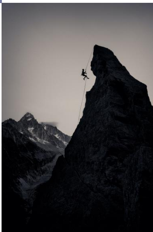
The boy and the beast de Xav le Fauve - CC-by-sa Prix de la catégorie action du concours 2019